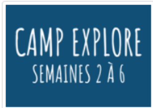
Explore semaine 2 à 6 (7-13 ans)