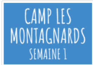
Camp les Montagnards sem. 1 (7-13 ans)