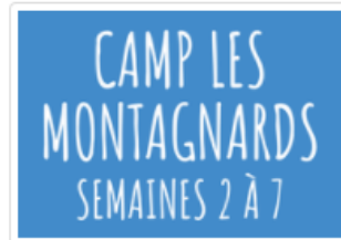
Les Montagnards semaines 2 à 7 (7-13 ans)