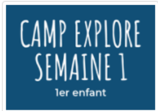
Camp Explore sem.1 (7-13 ans)

Vous aurez deux options de produits, peu importe le camp de jour auquel vous souhaitez inscrire votre enfant. Les produits avec l'intitulé « sem. 1 » représente la première semaine de camp. Il s'agit d'une semaine pour laquelle les frais sont moins élevés puisqu'il n'y a que quatre journées de camps. Les autres produits sont ceux pour des semaines complètes de camp, soit cinq jours. Le service de garde est inclus dans le prix.