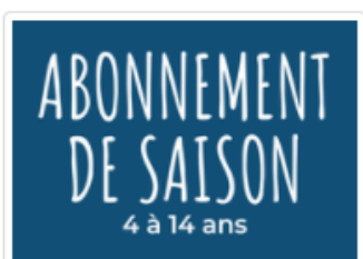
Abonnement de saison - 4 à 14 ans