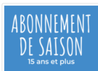
Abonnement de saison - 15 ans et +