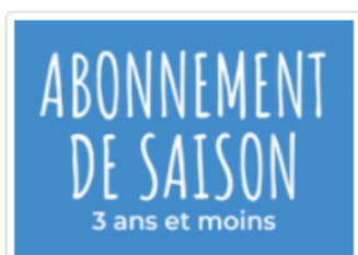
Abonnement de saison - 3 ans et -

Lorsque vous serez dans la catégorie de votre choix (Abonnements de saison), vous aurez la liste des différents abonnements offerts. Vous aurez les options pour chacun des groupes d'âges pour lesquels nous offrons des abonnements de saison.